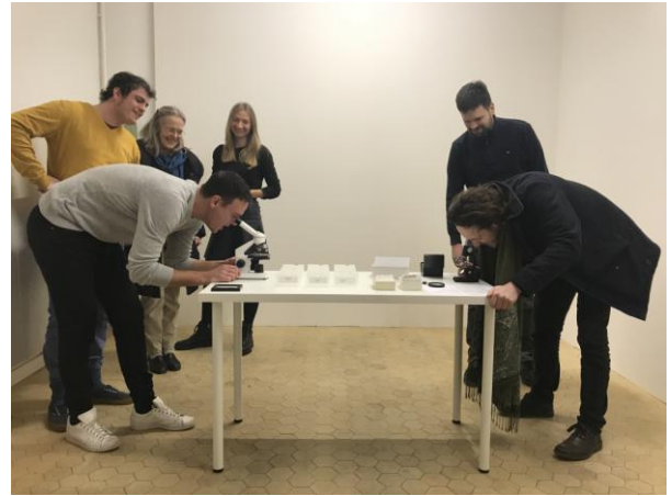
MICROCOLLECTION, Dreiviertel, 2019, Berna, CH

Recentissima produzione di MicroCollection è una serie di fotografie di frammenti di opere d'arte della collezione scattate con un microscopio ad altissima risoluzione quindi stampabili in grandi formati e su vari materiali.