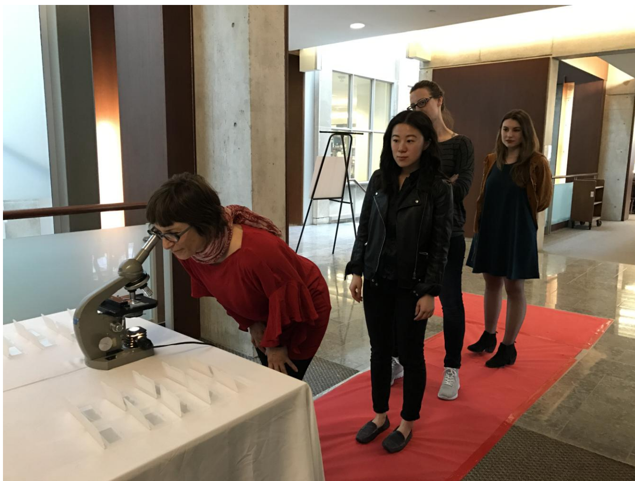
THE CABINET PROJECT a cura di ArtSciSalon, Università di Toronto, Canada, 2017

PAROLE CHIAVE: raffinatezza, trasparenza, trasformazione