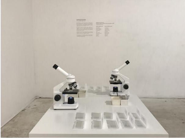
FOR REAL, ArtHelix Gallery con Shim, 2017, NY