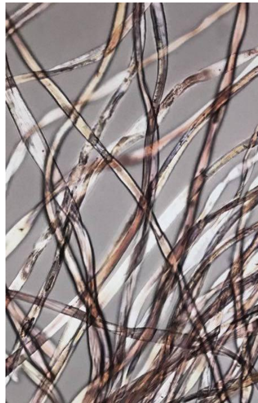
Frammento al microscopio, opera di Giulio Paolini